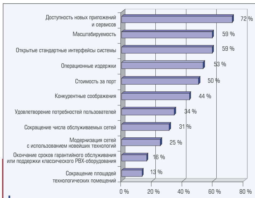
Рис. 1. Результаты исследований мотивации ответственных за принятие решения лиц компаний, развернувших IP-сети

Сосредоточиваясь на технических аспектах проектов, о мотивации зачастую забывают. Мы постараемся избежать подобного