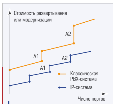
Рис. 2. Качественные характеристики стоимости развертывания или модернизации систем телефонии на основе РВХ с коммутируемыми каналами и IP-технологии

Характерные вертикальные отрезки на ступенчатых кривых рис. 2, обозначенные A1 (A1') и A2 (A2'), отражают «скачки» стоимости системы, обусловленные технологическими характеристиками выбранного оборудования. Причины их возникновения достаточно очевидны. Возможность конструктивов в случае РВХ исчерпывается с ростом числа портов, что вызывает потребность или в дорогостоящем расширении конфигурации, или в переходе на новую модель станции.